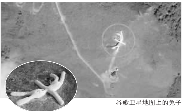
谷歌卫星地图上的兔子