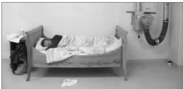
首批入住“无星级”酒店的顾客在房间里休息