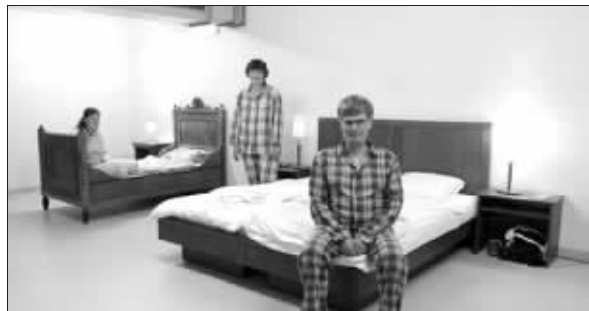
房间里除了床就只有四面墙,而且还是几个人住一间房

五星级酒店见得多了,“无星级”酒店你听过吗?近日,全球首家“无星级”酒店在瑞士一座废弃的核能避难所开业。