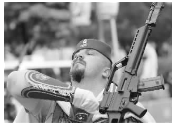
一名西班牙士兵在参加国庆阅兵仪式

据新华社电 西班牙反对党人民党主席马里亚诺·拉霍伊私下对出席国庆阅兵发牢骚,不料现场话筒未关,这番话被公之于众,令他颇为尴尬。