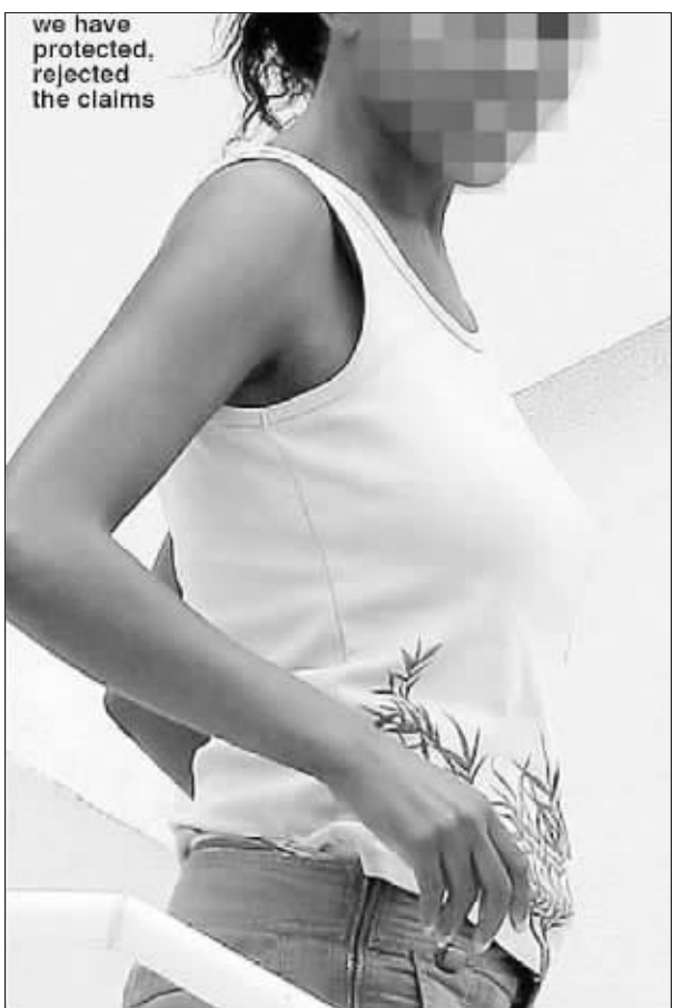
曾和奥巴马传出绯闻的神秘女子

在距美国11月4日的总统大选还有20多天,民意测验显示奥巴马的支持率显然领先于共和党总统竞选人麦凯恩。《新闻周刊》的一项民调显示,奥巴马的民意支持率高达52%,而72岁的亚利桑那州参议员麦凯恩的民意支持率只有41%,而在一个月前,两人的民意支持率还不相上下,都是46%。 兰西