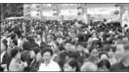
白马公园人山人海

紫色红色的青菜、100多公斤的巨型太空南瓜,诱人的龙袍汤包、清新爽口的香茅茶……昨天上午,第四届中国南京农业嘉年华在南京白马公园拉开帷幕,一大早,现场就已经挤满了来“赶集”的市民。150多种农特产品以及110多种高科技的奇菜奇花,让人满足口腹之欲的同时,也大饱眼福。