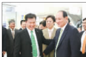
LG 全球 CEO 南镛在苏宁旗舰店考察“GG100”市场效果

基于“GG100”的合作基础, 双方决定将其拓展至全品类的深度合作和一项长期的合作, 因此诞生了“GG365”。“GG365”计划一方面延续了“GG100”的初衷, 将双方合作时间延长为全年, 而覆盖店面也设定为 365 家店, 从而使双方基本形成了长期不间断的战略合作。另一方面双方就五大项目进行了创新: 店面位置优化、卖场改造、产品差异化、服务全面升级以及数据对接透明化。