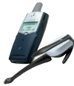
爱立信T39mc (带牙的手机)

手机博物馆开馆以来,由现代快报和越时空通信广场联合举办的“经典老手机”征集活动,得到广大手机爱好者的踊跃支持,他们不仅将珍藏多时的手机捐赠到“手机博物馆”,还记录下自己与手机的点滴故事与大家分享。