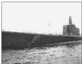
“银汉鱼”号潜艇资料照片