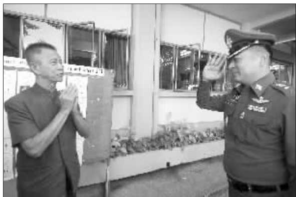
占隆(左)在选举投票后被警察逮捕