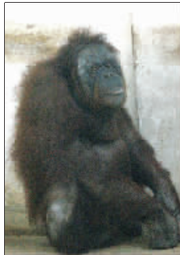
泰恣:我可是上过央视的

不过,随着岁月的流逝,泰恣慢慢显出老态,动作迟缓,腿上的红毛也变得稀疏。特别是2006年刚从杭州回南京的时候,泰恣又肥又呆,看起来像个“老太婆”。当时将它送到杭州是期盼它能与那边的猩猩配对,再怀个宝宝,结果去了一年都没成功,泰恣的身体状况、心理状况都越来越糟。