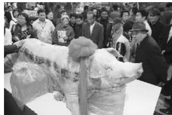
406公斤肥猪亮相沈阳农博会