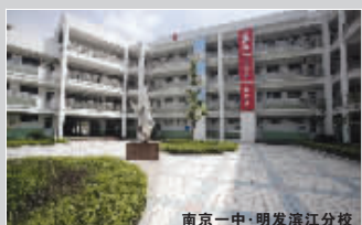
南京一中·明发滨江分校