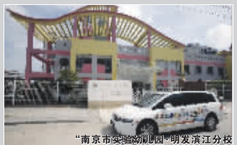
“南京市实验幼儿园”明发滨江分校

团购楼盘: 明发·滨江新城 团购时间: 9月29日-10月5日 团购报名热线: 96060/5887777