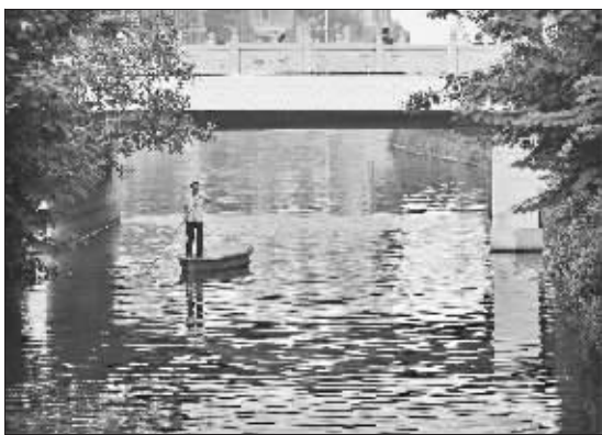
昨天,一名保洁员站在小船上,正在南京内秦淮河来回巡视,准备随时打捞漂浮在水面上的垃圾。经过连年治理,秦淮河的水质和环境正在不断改善。

面对中央路改造的最大难题,如何分流交通,怎样辟设公交专用道,市民可以拨打报热线96060支招。快报记者 鲍铭东