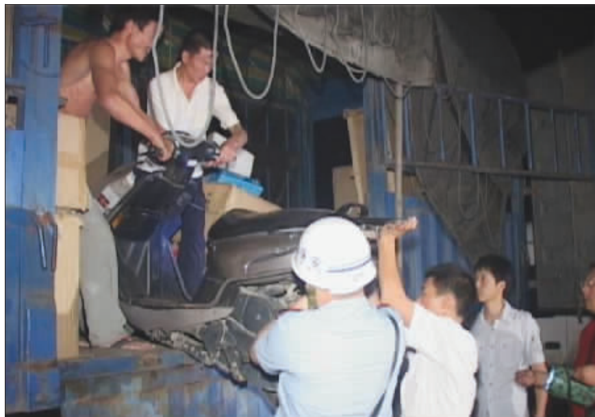
大货车上的助力车被卸下