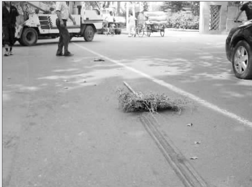
事故现场留下一把扫帚

昨天下午1点50分左右,江宁路车辆较少,秦淮区环卫工老方拖着扫帚,缓缓穿越马路。突然,一辆卡车疾驰而来,避让不及的老方被撞飞,头部重重着地,鲜血汩汩而出。截至记者昨晚发稿时,他仍未脱离生命危险。