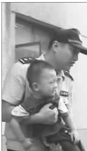
民警抱出被困男童