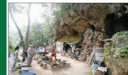
达摩古洞已破败不堪