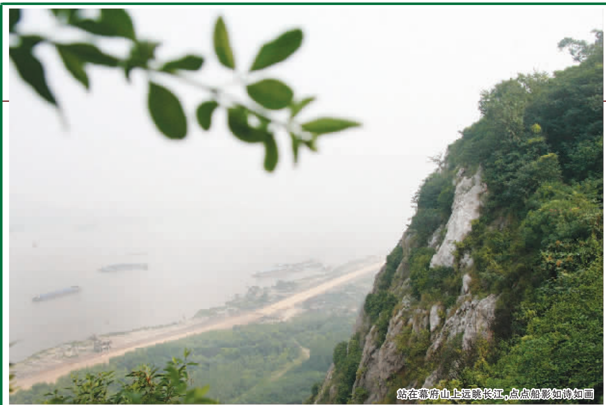
站在幕府山上远眺长江,点点船影如诗如画

幕府山比较“低调”。虽然在有关南京的旅游网页上可以搜到它,不过,只有寥寥数语。外地人来看南京,去的都是紫金山、栖霞山、狮子山;就算是南京本地人,恐怕也极少来这里。这一趟探访的开头,就迷了方向:明明已在幕府山脚,可就是找不到上山的路。询问附近住户,对方竟也瞠目结舌,说不出来。这实在有点奇怪。曾经,这座沿着长江绵延十余里的山,是南京地区最宜赏玩的景区,清代选定的“金陵四十八景”中,它独占六景:幕府登高、嘉善闲居、达摩古洞、永济江流、化龙丽地、燕矶夕照。“上榜”数量位居南