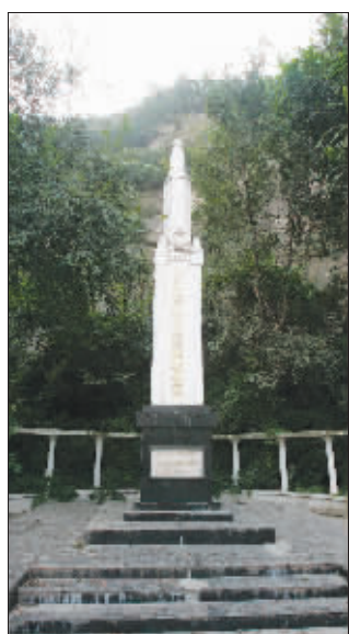
幕府山下的草鞋峡遇难同胞纪念碑