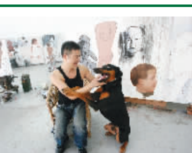
一位画家与爱犬嬉戏

外坑坑洼洼,布满无数个细小的洞——这是五六亿年前,古海洋留下的印记。也许,石壁上还镶嵌着各种各样海洋生物的化石。那时,这里是一片汪洋,直到1亿多年前,发生大规模的造山运动,古海洋沉积物抬升,于是就有了这座山。而幕府山的名字,则晚得多。直到晋代,丞相王导在此建幕府,才因此得名。江山相依,石景丰富,动植物繁杂,从六朝时起,这里就出了名的风水宝地,所以有了考古学家发现的古墓葬群:晋穆帝陵、宋明帝陵……大书法家王羲之的家族墓地,也位于此。它还是皇家偏爱的饮酒作乐、狩猎之