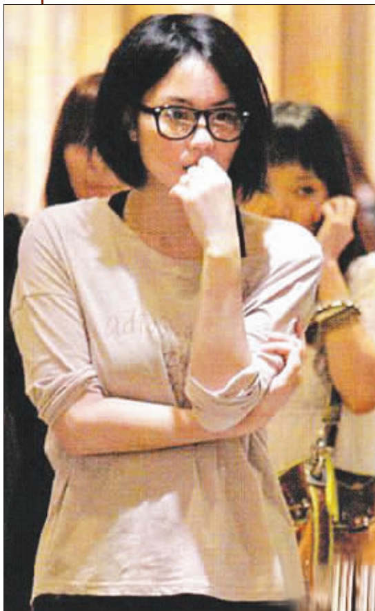
到港后的王菲一脸愁容