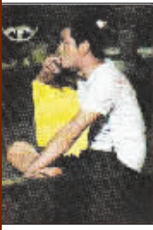
8月初至今,李亚鹏经常被传媒拍到独自抽烟的场景