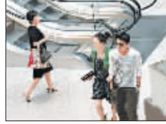
两人的亲密样羡煞路人