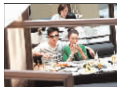
吃完后,柏芝抽空补个靓妆