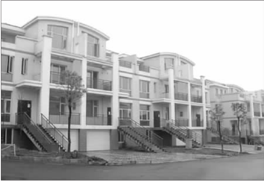
审计署驻长沙特派员办事处违规修建的别墅

审计署驻长沙特派员办事处在新湖南省政府宿舍楼对面以修建职工宿舍楼名义违规修建百余套别墅。该宿舍楼成为新湖南省政府方圆几公里内的绝版别墅,与市场价比较,一套别墅的价格仅仅是市场价的四分之一。而在用地的审批过程中,促成半价拿地的,就有湖南省一名主管副省长和湖南省国土资源厅相关领导为此“出力”。