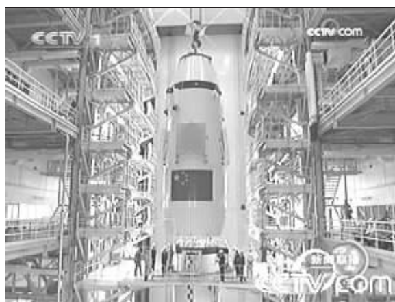
火箭整流罩与火箭箭体进行对接