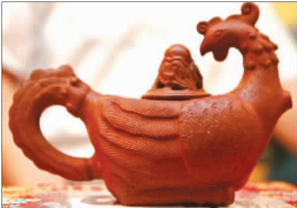
宜兴窑凤凰紫砂壶。

在开展之前,台湾成阳艺术文化基金会珍藏的64件外销紫砂精品都被放在各色锦盒里。成阳基金会执行长宋信德随手开启了一只锦盒,一把精致的核桃色镂空茶壶光彩夺目,名为宜兴窑镂空梅花纹紫砂壶的这把壶不仅看上去品相很新,而且壶盖捏子上镶了金,壶把和捏子之间还连接着两根精致的金链子,壶底上了一圈金边,壶嘴还包了金口。“这就是外销到荷兰后,为了保护茶壶,也为了提升它的价值,给壶‘化妆’。”握着这把壶,十