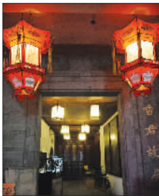
香君故居,像是给主人立的一块碑