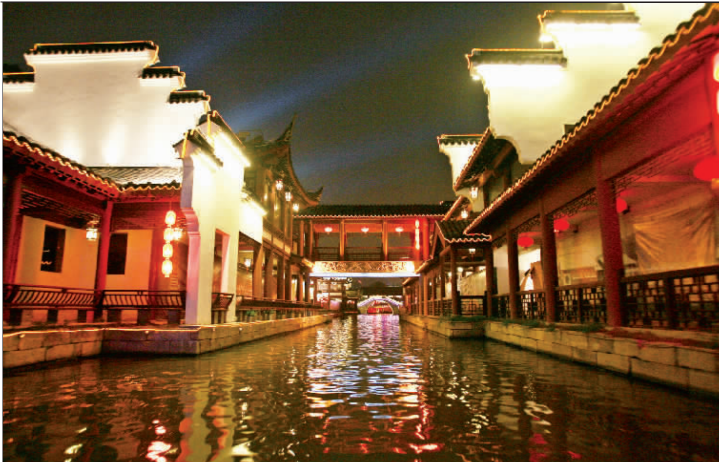
霓虹灯装扮的秦淮河已与风月不相干