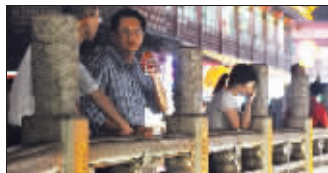
“君子不过文德桥”的说法已不适用