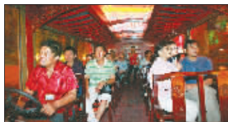
坐着画舫穿行水中,丝竹弦乐远远飘来