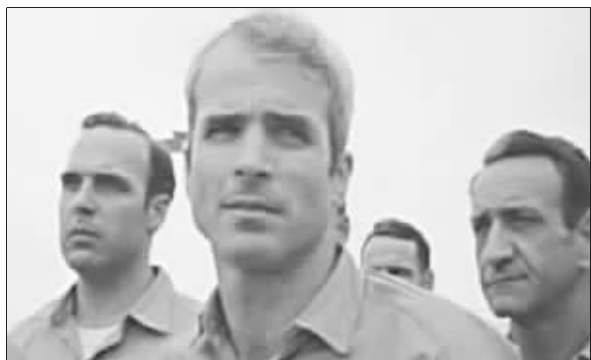
麦凯恩(中)神情忧郁

委内瑞拉总统乌戈·查韦斯11日要求美国驻委内瑞拉大使72小时内离境,同时威胁停止对美国供应石油。美国国务院发言人12日说,美国国务院已经通知委内瑞拉驻美大使“他将被驱逐出境”。