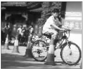
绕桩考试

笔试后,学生们来到了学校的院子里,空地上每隔1米摆一个红色锥桶,一共有十来个。学生必须逐一绕过锥桶,速度要平稳,中途不能停车,不得撞倒锥桶。原以为简单的绕桩,竟然有好几个看似挺老练的男孩子“卡了壳”。交警表示,十来岁的孩子争强好胜,喜欢“飙车”,却忽略了稳定性。在此次考试中,100名学生中,只有4人没通过,且全部是男生,原因都是一样的,就是粗心大意和太急躁。