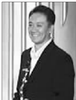
李幼斌凭《闯关东》拿下大奖