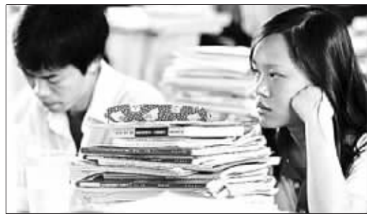
高考方案历来是社会关注焦点 资料图片

不过也有相关人士指出,这种方案在十年前就已经弃用了,现在面临的是新课改,是否能够匹配还需要再论证。