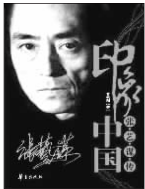
黄晓阳 著 华夏出版社友情推荐

北京奥运会开幕式完美谢幕了,总导演张艺谋的功力臻于炉火纯青。开幕式后,张艺谋在接受采访时说——我本质上就是一农民。