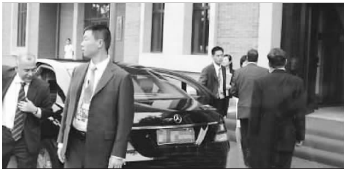
罗巧彬在外国政要警卫工作中 资料图片