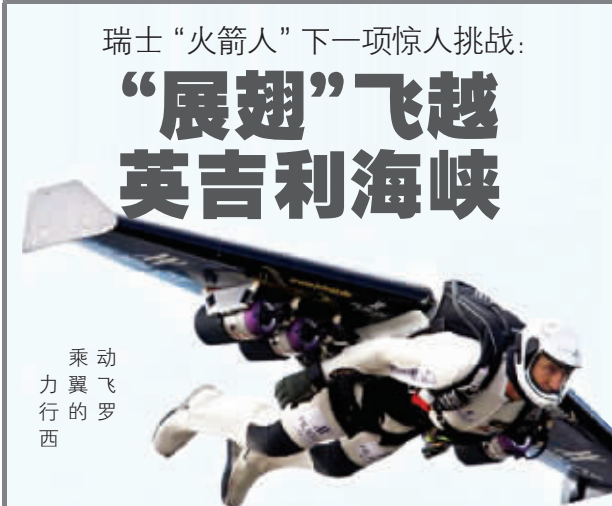
乘动力翼飞行的罗西

事情并没有就此了结,抛弃了亲生骨肉的少女第二天在邻居的陪同下来到了医院,并向当局承认这个孩子是她所生。目前这个少女正在医院接受精神方面的治疗。 董楠