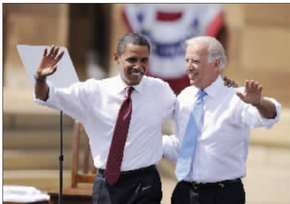
奥巴马(左)与竞选伙伴拜登首度共同亮相

美国民主党总统竞选人贝拉克·奥巴马23日宣布特拉华州联邦参议员约瑟夫·拜登为竞选搭档。当天下午奥巴马在伊利诺伊州首府斯普林菲尔德市举行集会,首次与拜登公开亮相。