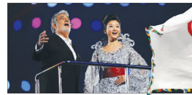
▲多明戈与宋祖英在闭幕式上献唱