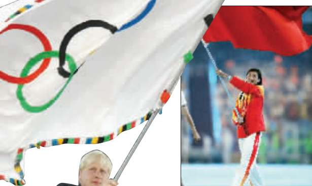
▲伦敦市市长约翰逊手举奥林匹克会旗