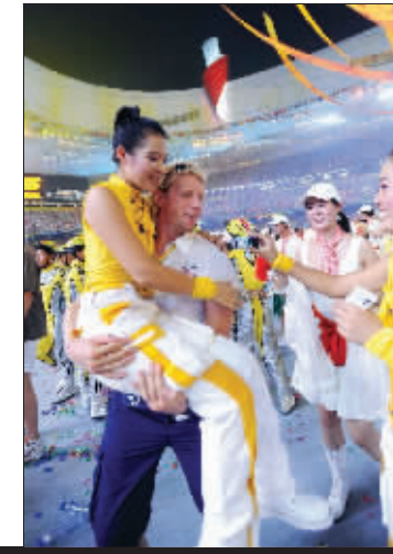
▼闭幕式结束后,一名运动员和一名演员合影