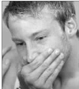
米查姆兴奋夺冠

昨晚的跳水冠军马修是个面容清秀、情感细腻的小伙儿。站到领奖台上时,他的眼圈依然红红的。本届奥运会上,他成为北京奥运赛场唯一获得跳水金牌的外国选手。