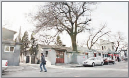
霍家以四合院作为聘礼