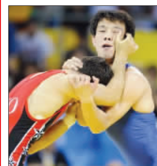
设计台词:裁判:摔跤不许狞脸!