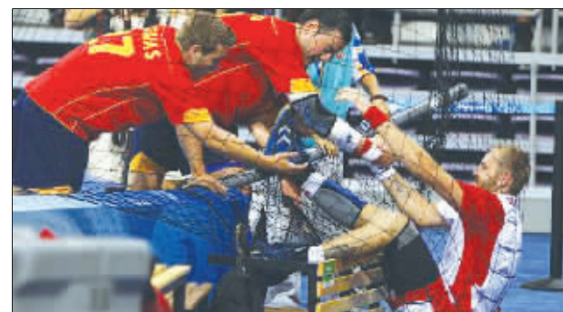
设计台词:球没打着,还落网了!落网就算了,还被敌人捞起来,都怪出门没看星历。