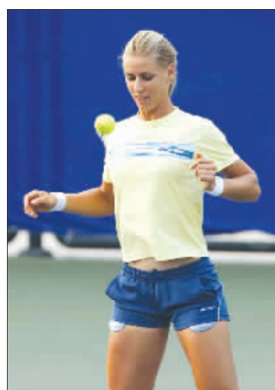
设计台词:弹力球?还有那短裤都有这毛病,内袋太长,动不动就露到外面。