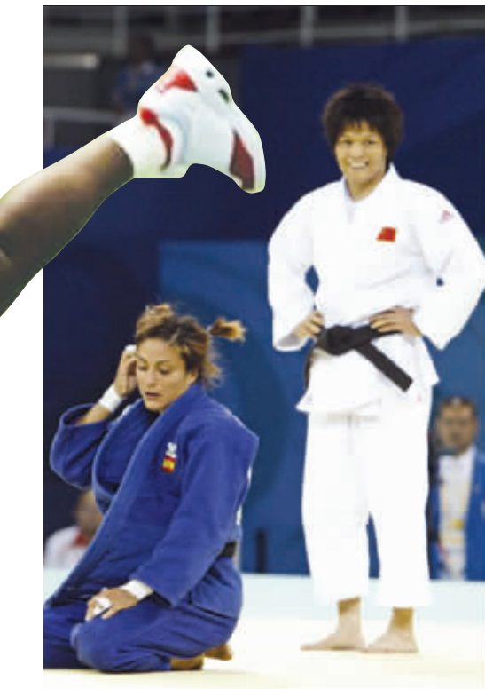
设计台词:外国MM:“东妹,你我同为女人,为何下如此毒手?” 东妹:“难道你不知道,女人也分好多种的吗?嘿嘿!”