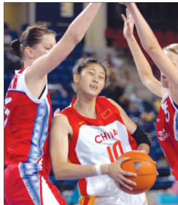
设计台词:梦里游啊游,我梦到姚明要我嫁给他,太高兴了!