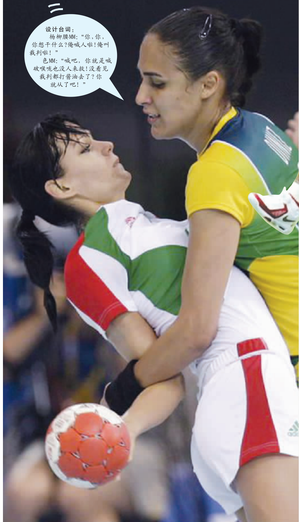
设计台词:杨柳腰MM:“你,你,你想干什么?俺喊人啦!俺叫裁判啦!” 色MM:“喊吧,你就是喊破喉咙也没人来救!没看见裁判都打着油去了?你就从了吧!”