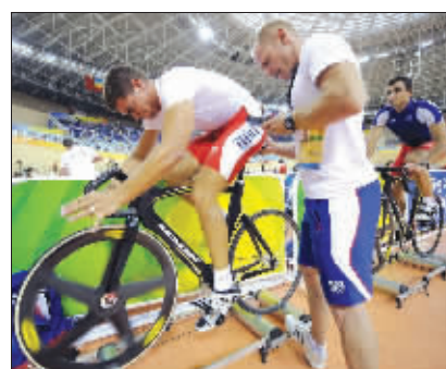
设计台词:尾气超标,注意饮食!