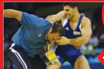
设计台词:神顺手了,连裁判也敢拜。