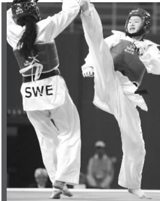
2008年2月26日,吴静钰参加跆拳道比赛