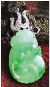
千年翠钻“鼎祥”翡翠

奥运会带来了中国传统文化的回归和奥运元素的火热，也让以翡翠、玉为设计元素的产品成了本届珠宝奥运竞技场的主角。正如千年翠钻赠送省奥运冠军的奖品“鼎祥”翡翠，翠体温润华美，金饰巧制圣火造型并镶嵌以钻石，璀璨夺目。据了解，这款“鼎祥”翡翠独创了“碎钻微镶”的专利型工艺，将“金镶玉”工艺进行了革新。铂金、翡翠和钻石的大胆创新，金拉丝、镂空雕刻等传统工艺的运用，让这款时尚翡翠饰品成为奥运期间的宠儿。据悉，千年翠钻除赠送奥运夺牌奖品外，还特别研发了“08珍藏版”翡翠系列，以满足奥运期间的饰品需求。