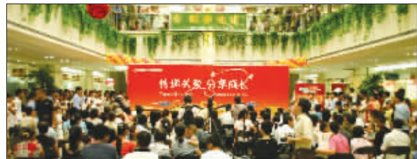
红太阳家居迈皋桥店活动现场

8月16日上午9点,红太阳家居迈皋桥店门前一派喜庆、热闹的场景。数千名家长带着小宝宝们或聚集在门前欣赏节目表演,或是穿梭在家居卖场内,体验购物的乐趣。与红太阳家居“庆奥运亲子活动”一起,圣象地板重装开业活动也进行得有声有色。儿童们穿上滑轮,在地板上自由展示速滑技巧,音乐与礼花让每个参加活动的人都满怀兴奋。