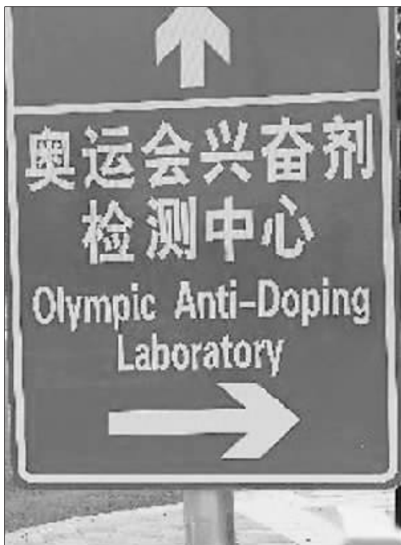
奥运会兴奋剂检测中心

求可高了。为了确保全过程公正、不留舞弊空间,他必须要与运动员保持较近的距离,使运动员在到达兴奋剂检查站前始终处于其视线范围之内。当然,又不能过于影响到受检运动员的感受。如果出现异常情况,陪护员必须立即向自己的主管报告。