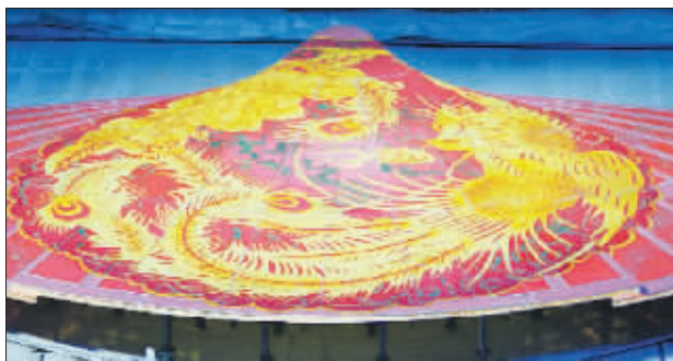
华丽的巨大扇阵,开幕式最终还是忍痛放弃。

开幕式时,战士们屈身躲在活字里,下午两点就得钻到字模里。虽然字模由特殊的纱制成,但正值炎夏,897 个人挤在一处,十分闷热,并且要呆上六