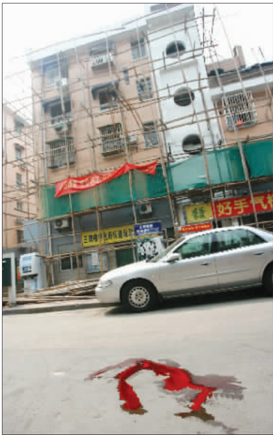
令人心悸的事故现场

昨天上午,一名民工在南京三牌楼大街附近西瓜圃桥一居民楼楼顶施工时,被卷扬机架从五楼弹飞向楼下马路。就在这时,一名中年女子刚好骑车经过,民工坠落的身体不偏不倚重重地砸在女子身上,“幸运”与“不幸”瞬间交换了主人。