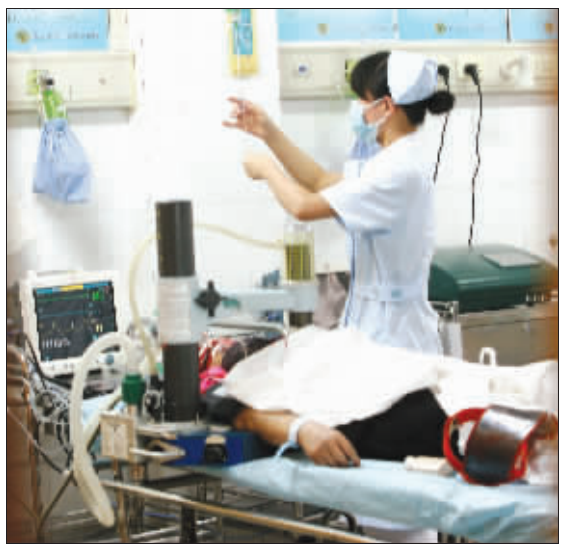
尽管医生奋力抢救,被砸的女子还是走了

卷扬机操作被卡拉翻支架 现场迅速拉起了警戒线,记者看到,骑车女子留在地面的血迹有好大一摊。