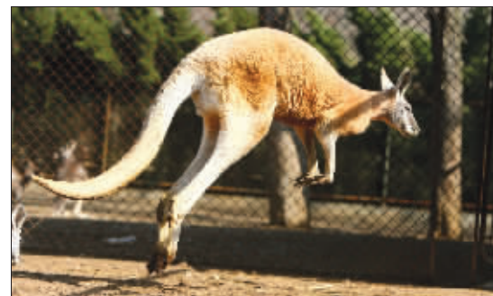
彪悍的新袋鼠王

“袋鼠一向有运动精神,比如成年公袋鼠从来不会去打母袋鼠和小袋鼠。但在王位面前,它们的狠劲也毫不含糊。”专家说,这种优胜劣汰的生存之道听起来残忍,对整个袋鼠家族来说,却是有利的——只有最强壮最优秀的血脉,才能得以延续。快报记者 孙兰兰