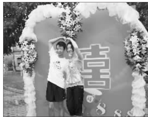
民政局门口留影的新人