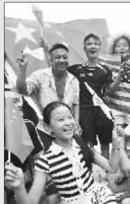
年轻人摇旗呐喊，为中国加油