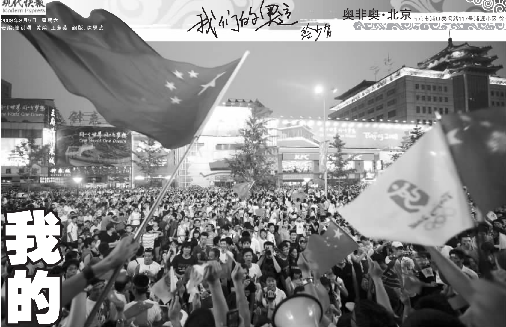
万余市民齐聚王府井大街，收看开幕式直播