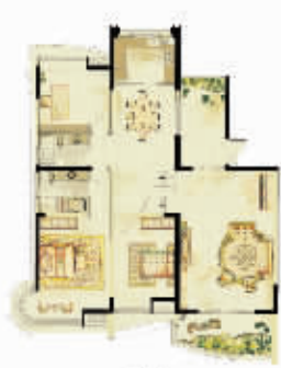
空中别墅 五房三厅四卫 306m 2