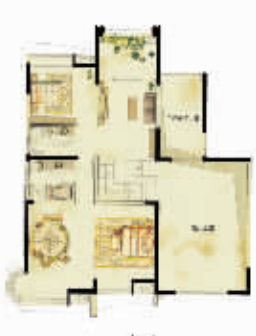
平层尊邸 五房两厅三卫 270m 2

雅居乐花园激情夏日,三重“豪”礼,凡8月1日—27日成交客户,均有惊喜回馈。详情请咨询销售中心。