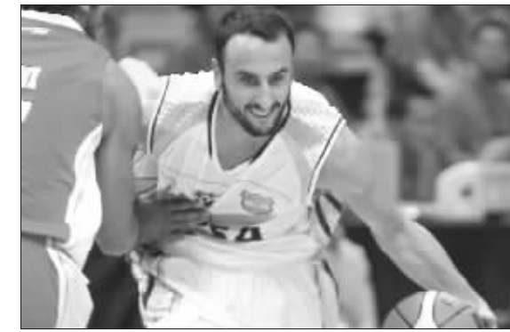
吉诺比利能恢复到最佳状态吗?