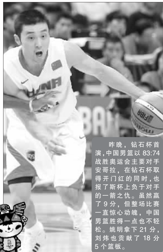
昨晚, 钻石杯首演, 中国男篮以 83:74 战胜奥运会主要对手安哥拉, 在钻石杯取得开门红的同时, 也报了斯杯上负于对手的一箭之仇。虽然赢了 9 分, 但整场比赛一直惊心动魄, 中国男篮胜得一点也不轻松。姚明拿下 21 分, 刘炜也贡献了 18 分 5 个篮板。