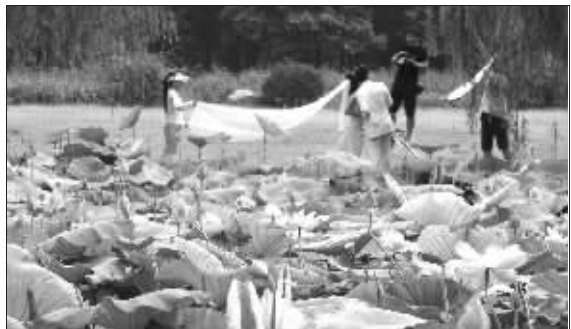
池塘里的荷花进入盛花期

今天是农历六月二十四,在古代,据说今天正是荷花的生日,又叫“观莲节”或“采莲节”。