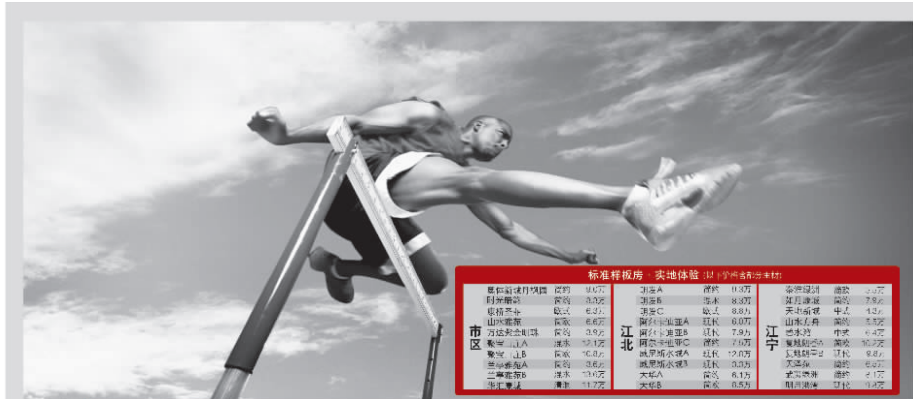
标准样板房·实地体验(以下价格均为参考价)

家居乐大型建材超市(龙蟠路403号)金盛国际(江东门)负一楼B区10号 石林广场(光华门)一楼1010号 网址:www.njshikang.com