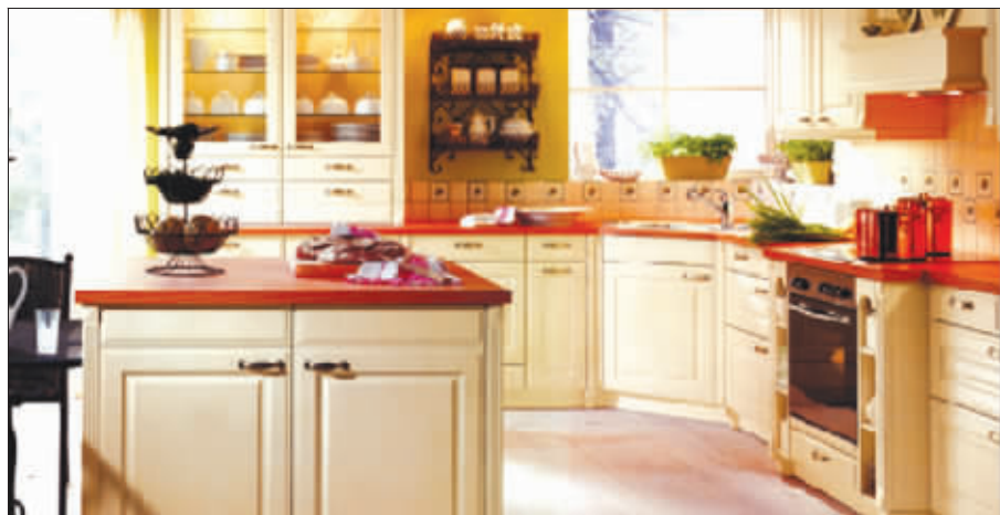
东方邦太北欧风情橱柜

上周六,参与快报家装俱乐部“家装建材团购夏令营”活动的读者,在柏林地板超市享受了吃西瓜喝啤酒买地板的乐趣。本周日,“夏令营”第二场活动将开进南京龙头橱柜品牌东方邦太,并将给参与的读者带来更多惊喜。