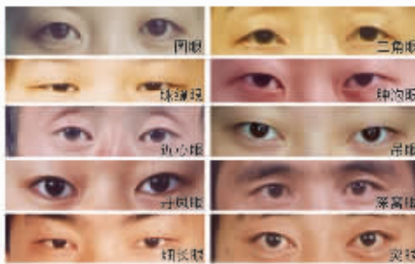
图例(1) 很适合手术的眼眶的类型

最美丽的眼睛,必定绽放桃花般的风采、神韵和灵气。周院长的“桃花眼”手术特点:眼睛大而圆,眼外侧向外上方扬起,同时双眼皮形状内窄外宽向外上方舒展,真正实现小眼、圆眼、三角眼、眯缝眼、肿泡眼、细长眼向标准“桃花眼”完美蜕变。