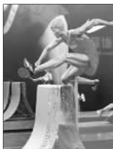
塑料模特做出跨栏动作

在罗伯斯跑出 12 秒 88 的成绩后,国际田联在官方评论中已将他定义为了当今世界男子 110 米栏的第一人,因为“他是历史上发挥最为稳定的选手”。罗伯斯是否真是当今世界男子 110 米栏的第一人,目前尚不得而知,但他确实已成为刘翔卫冕奥运冠军的最大敌人。