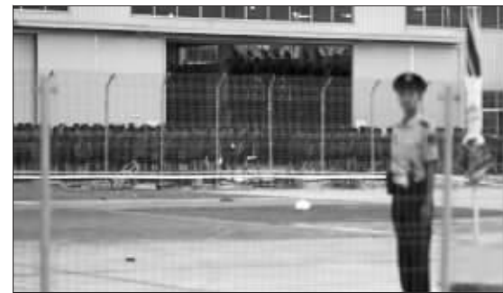
武警把守着仓库大门