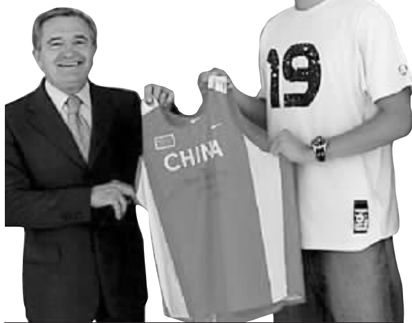
刘翔展示新比赛服