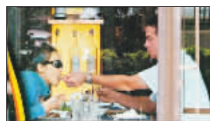
中娱 好吃你就多吃点(设计对白)