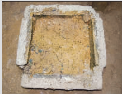
舍利函就在铜钱下面