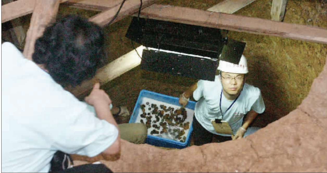
文物专家在现场指导发掘