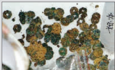
被清理出来的铜钱