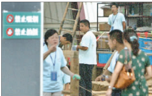
大报恩寺地宫开启现场凭证进入。