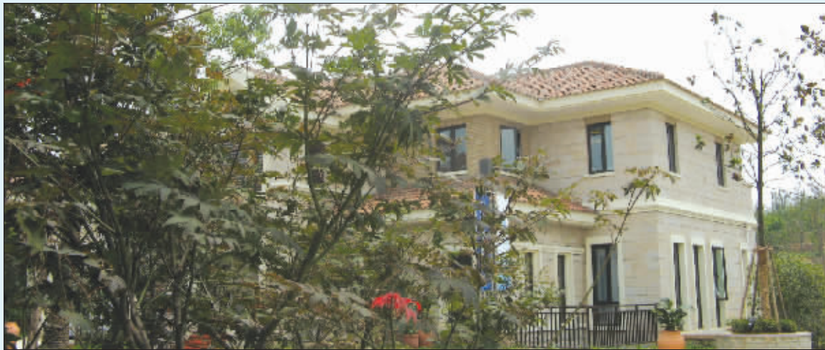
招商·依云溪谷实景图

12个项目城市,19个销售项目,58个在建项目,75万平米销售面积,530万平米在建面积,1000万平米土地储备,血脉相承招商局百年企业的使命和精神,基业常青,使命长存,招商地产见证中国房地产发展并引领未来。