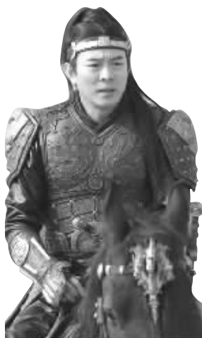
李连杰扮演的帝王