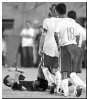
倒地了,裁判还紧紧抓着红牌。