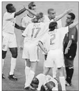
这么多人来理论,这位裁判还挺镇定。